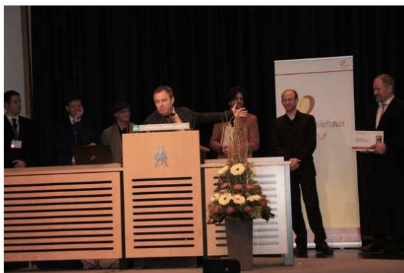
91 of 100 possible points for smartwin compact S from pro Passivhausfenster (pPHF). Passed in by smartwin partner Sepp Lorber Styria.

Source: Passive House Institute – Component award